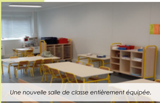
Une nouvelle salle de classe entièrement équipée.

Les autres écoles ont également bénéficié de réfections : les radiateurs ont été changés aux Barbières, du matériel neuf a été livré et des stores réparés. La municipalité tient à remercier l'ensemble des services municipaux et des intervenants qui ont travaillé dur pour que tout se passe au mieux.