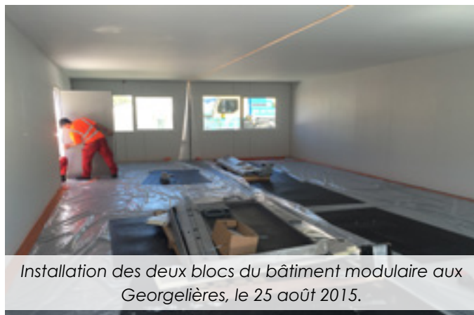
Installation des deux blocs du bâtiment modulaire aux Georgelières, le 25 août 2015.

L'année scolaire 2015-2016 a débuté sous les chapeaux de roues pour les enfants et les enseignants. Pour cette rentrée, le nombre d'enfants inscrits est en forte augmentation. La maternelle compte 290 inscrits contre 257 précédemment. Face à cet accroissement et grâce à l'investissement collégial de la mairie et des directeurs d'écoles, l'inspection académique a décidé, début juillet, de créer une classe supplémentaire aux Georgelières. La municipalité a tout mis en oeuvre, pendant l'été, pour que cette nouvelle classe puisse voir le jour à la rentrée. Ainsi, pour accueillir les enfants dans de bonnes conditions le 1 er septembre dernier, la ville a investi dans une nouvelle structure adaptée. Il s'agit d'un investissement de 93 000€ HT. D'une superficie