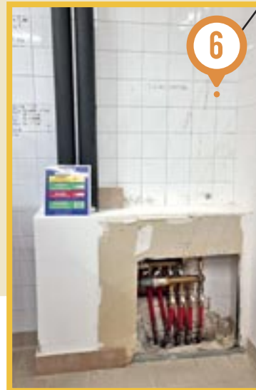
Restaurant scolaire Joseph Domeyne • Réparation du plancher chauffant