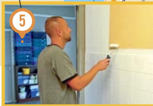
Ecole des Geogelières • Travaux murs et faïences des sanitaires réalisés par les services techniques