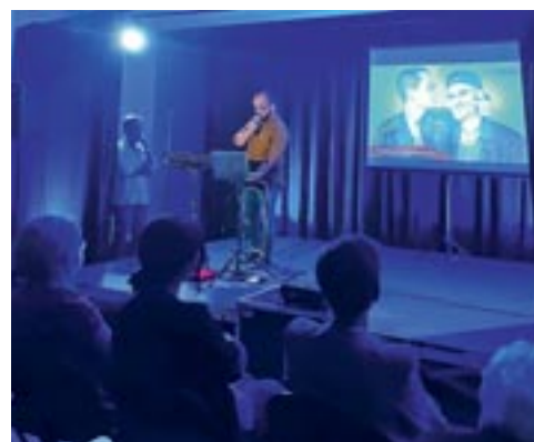
Pour acheter vos places, rendez-vous à l'accueil de la Mairie et à l'accueil de la MJC.

Découvrez tout le détail dans le guide culturel joint à votre magazine et sur la page facebook officielle : "Saison culturelle de Chasse-sur-Rhône"