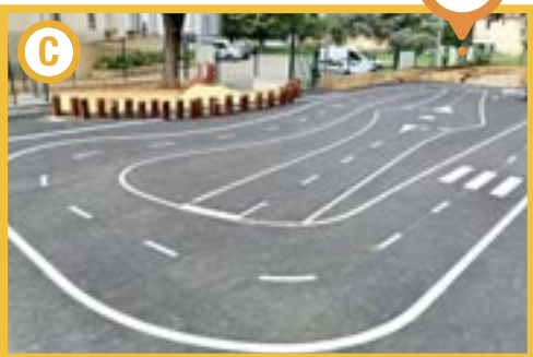
Ecole maternelle du Château • A Remplacement des cuves du système de chasse d'eau • B Installation et aménagement du nouveau modulaire (porte manteau et meuble de rangement de chaussures) • C Traçage de la nouvelle piste vélo dans la cour.