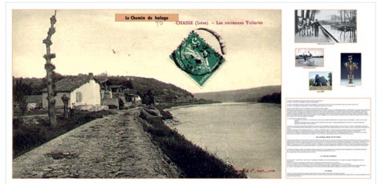
Exemple de panneau qui vous était présenté à chaque lieu de rendez-vous. Ici le chemin de halage et une des anciennes tuileries.

Les 18 et 19 septembre 2021, la MJC participait pour la 1 ère fois aux journées du Patrimoine.